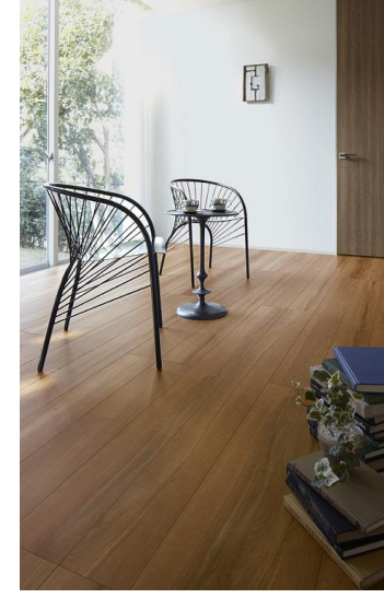
DY Cherry チェリー

NEW 本来の木味を生かした、野性味のある風合いが特徴。節やガムスポットの存在が杳理の表情をより豊かに見せる。