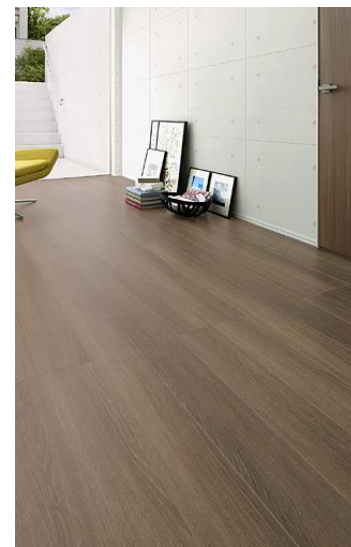
D6 Oak オーク

水のカルシウム分がオーク導管に沈着した意匠を表現。ナチュラルでありながらモダンが薫る新鮮な空間が生まれる。