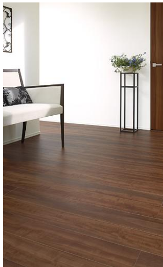
D4 Pear ペア

穏やかで細やかな木肌や、ステイン仕上げの独特なツヤ感を表現。重厚でエレガンス漂う上質な空間づくりに。