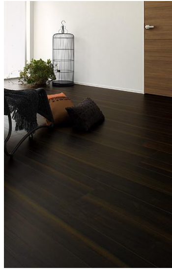
D5 Black Walnut ブラックウォールナット

染色しやすく木理の美しい、ブラックウォールナット。樹皮に近い白太の部分モチーフに。表情豊かな空間を創造。