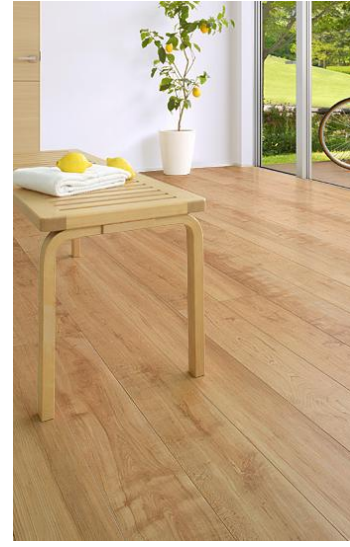
D2 Maple メープル

杳の美しさが際立つメープル材の芯材と辺材を取り混ぜたような、個性的な濃色と淡色のミックスを表現。