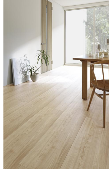
DX Chesnut チェスナット

NEW 灰白色の明るい色調の杳理を生かし、使い込んだ味わいのグレイッシュホワイトに。質朴でノスタルジックな風合いに調和。