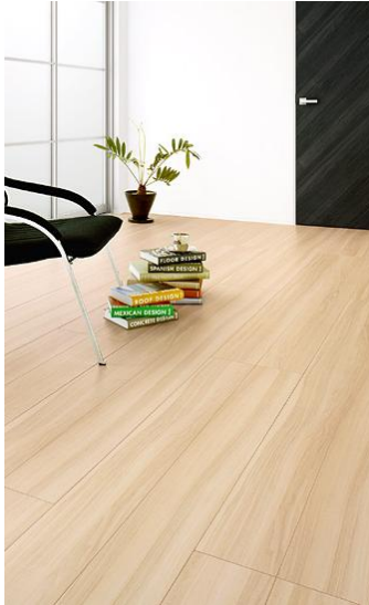
D1 Italian Walnut イタリアンウォールナット

脱色による「白」や温もりのある木肌の質感を表現。自然なグラデーションがスタイリッシュな仕上がりに。