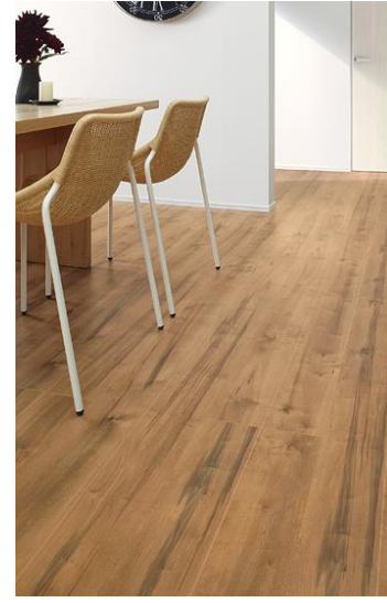
D3 Light Maple ライトメープル

水に含まれるミネラルが黒変沈着した意匠を表現。時が醸成した重厚な趣とアンティークテイストが魅力。