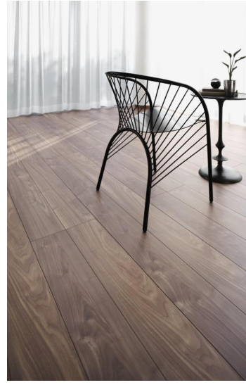
DZ Walnut ウォールナット

NEW 変化に富んだ表情は、豊かで深みのある空間を創り出す。木味である濃淡と紫味を帯びた色を生かしてグレイッシュトーンに。